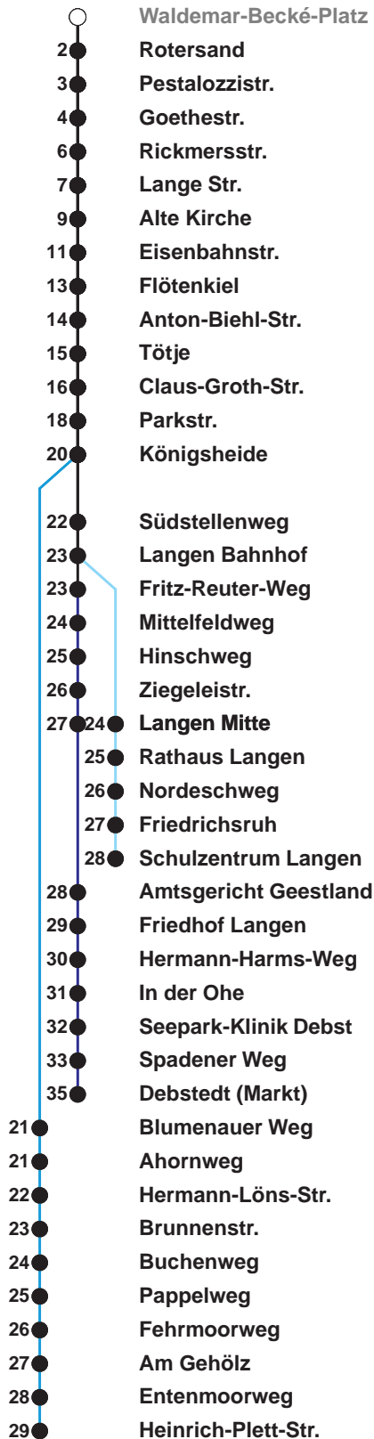
Linienvverlauf und Fahrtzeit in Min.

Heiligabend nach Sonderfahrplan / Silvester nach Samstagsfahrplan