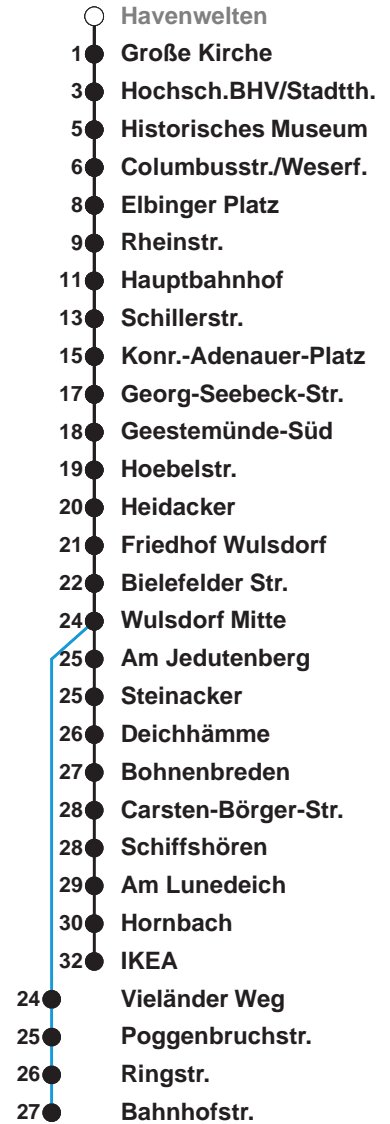
Linienvverlauf und Fahrtzeit in Min.

Heiligabend nach Sonderfahrplan / Silvester nach Samstagsfahrplan