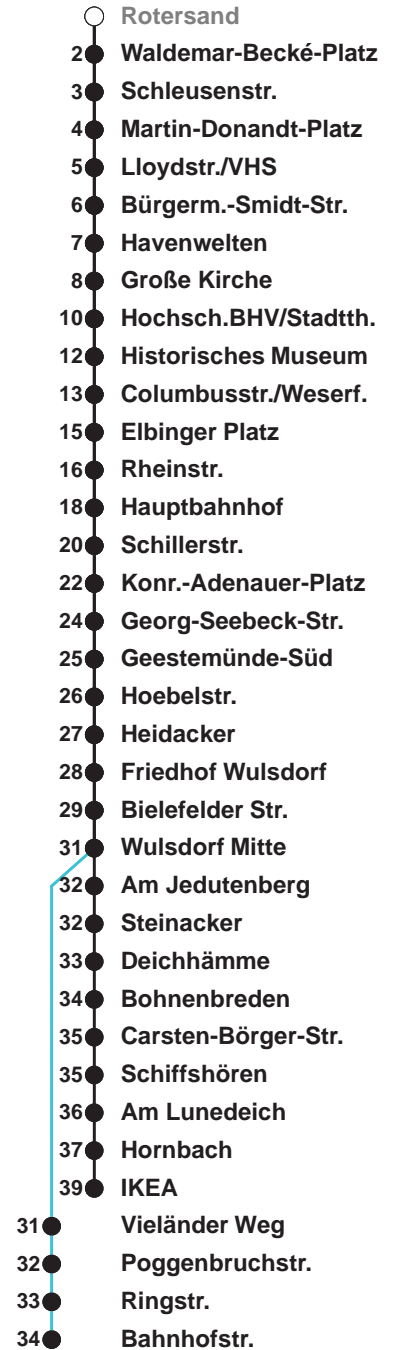
Linienvverlauf und Fahrtzeit in Min.

Heiligabend und Silvester nach Sonderfahrplan