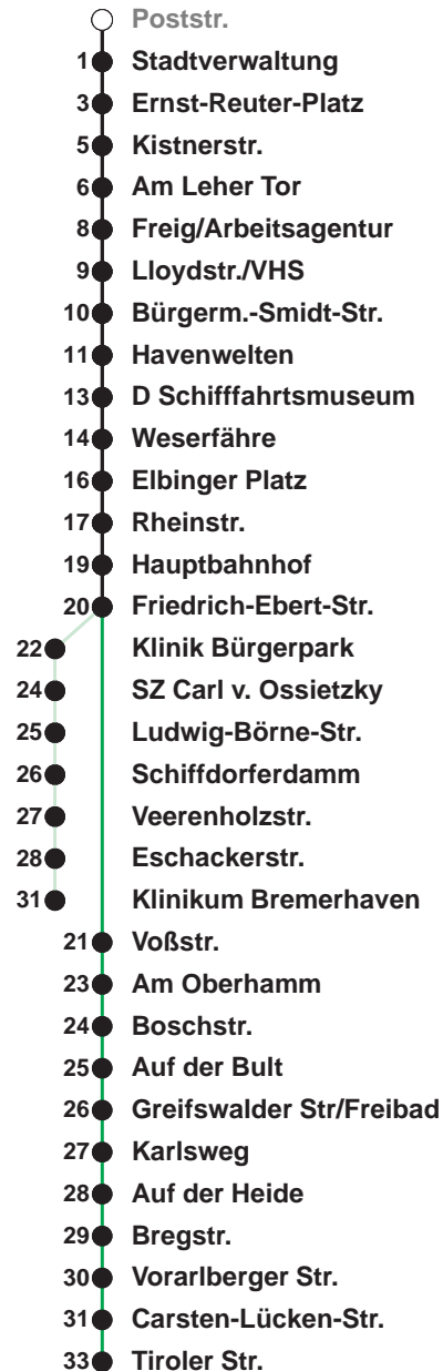
Linienvverlauf und Fahrtzeit in Min.

Heiligabend und Silvester nach Sonderfahrplan