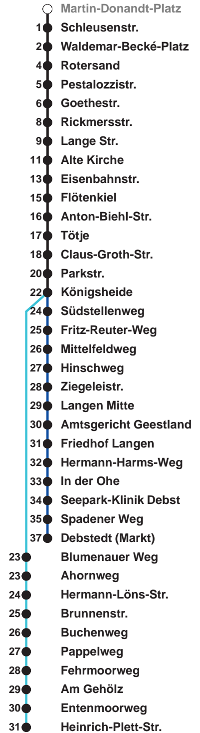
Linienvverlauf und Fahrzeit in Min.

Heiligabend und Silvester nach Sonderfahrplan